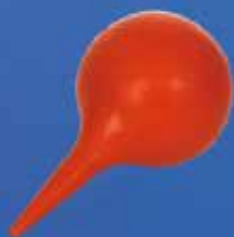
Perillas de hule y PVC