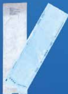
Bolsas para esterilización