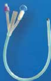
Sondas Foley de silicón