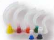
Canulas de Guedel