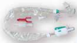
Sistema de Succión