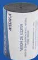
Vendas de Goma Smarch