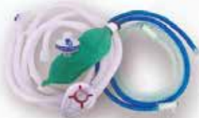
Circuito de Anestesia y Ventilación