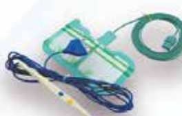
Lápis y placa de Electrocauterio